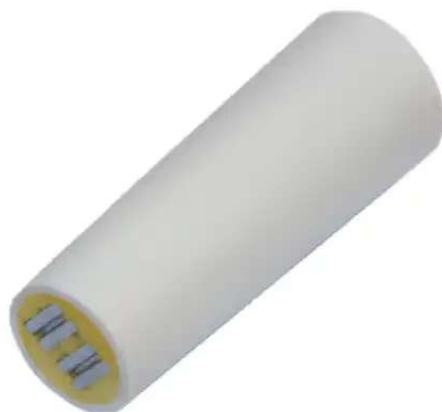
Figure 1 : Vue 3D